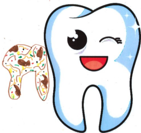
Kristýna Gladišová, 2.tř.

Projekt Bezpečně ve škole i mimo školu zaměřený na prevenci úrazů a bezpečnost žáků se uskutečňuje vždy na začátku školního roku pro žáky 1. i 2. stupně. V září, po prázdninách, jsme si připomněli, že i ve škole musíme dávat pozor, aby se nestal žádný úraz. Probrali jsme, jak řešit svoji bezpečnost, slušně a taktně se chovat ve škole i na veřejnosti, ale i jak zvládat neočekávané konfliktní události.