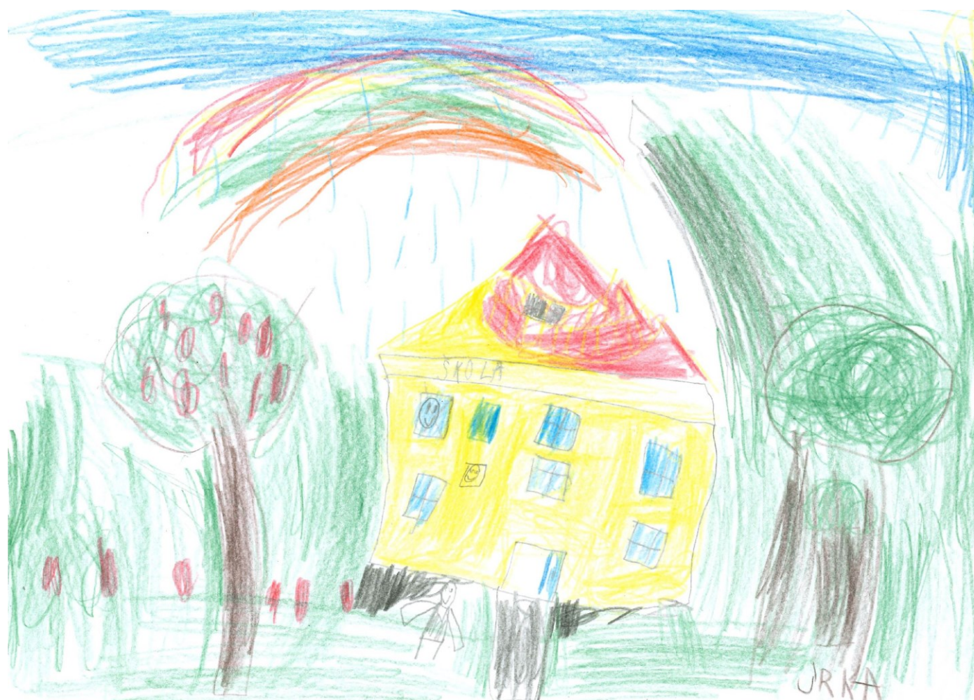
Jiří Galaš, 2.tř.