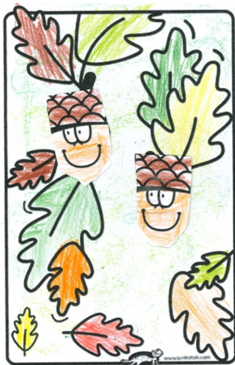
Aleš Vichlenda, 3.tř.

Díky výtvarné činnosti se děti učí správně držet psací potřeby, stříhat nůžkami, kreativnímu myšlení nebo rozvíjí dětskou fantazii.