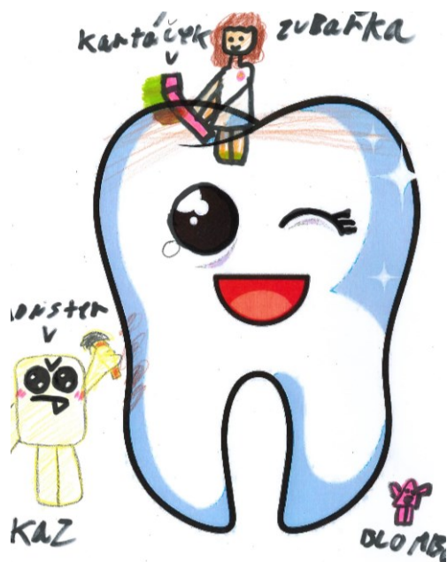
Aneta Bendová, 4.tř.

Dále jsme pro děti připravili program k posílení zodpovědnosti za zubní zdraví nazvaný Veselé zoubky . V úvodu žáci zhlédli krátký motivační film s Hurvínkem o jeho trápení s bolavým zubem. V další části plnili na interaktivní tabuli úkoly zaměřené na péči o zdravý chrup. Dozvěděli se vše o zubním kazu a jak se o zuby správně starat. Vybírali vhodné potraviny a řešili problémové úkoly – co dělat, když zuby bolí, došlo k jejich úrazu či ztrátě a proč je důležité chodit na preventivní prohlídky.